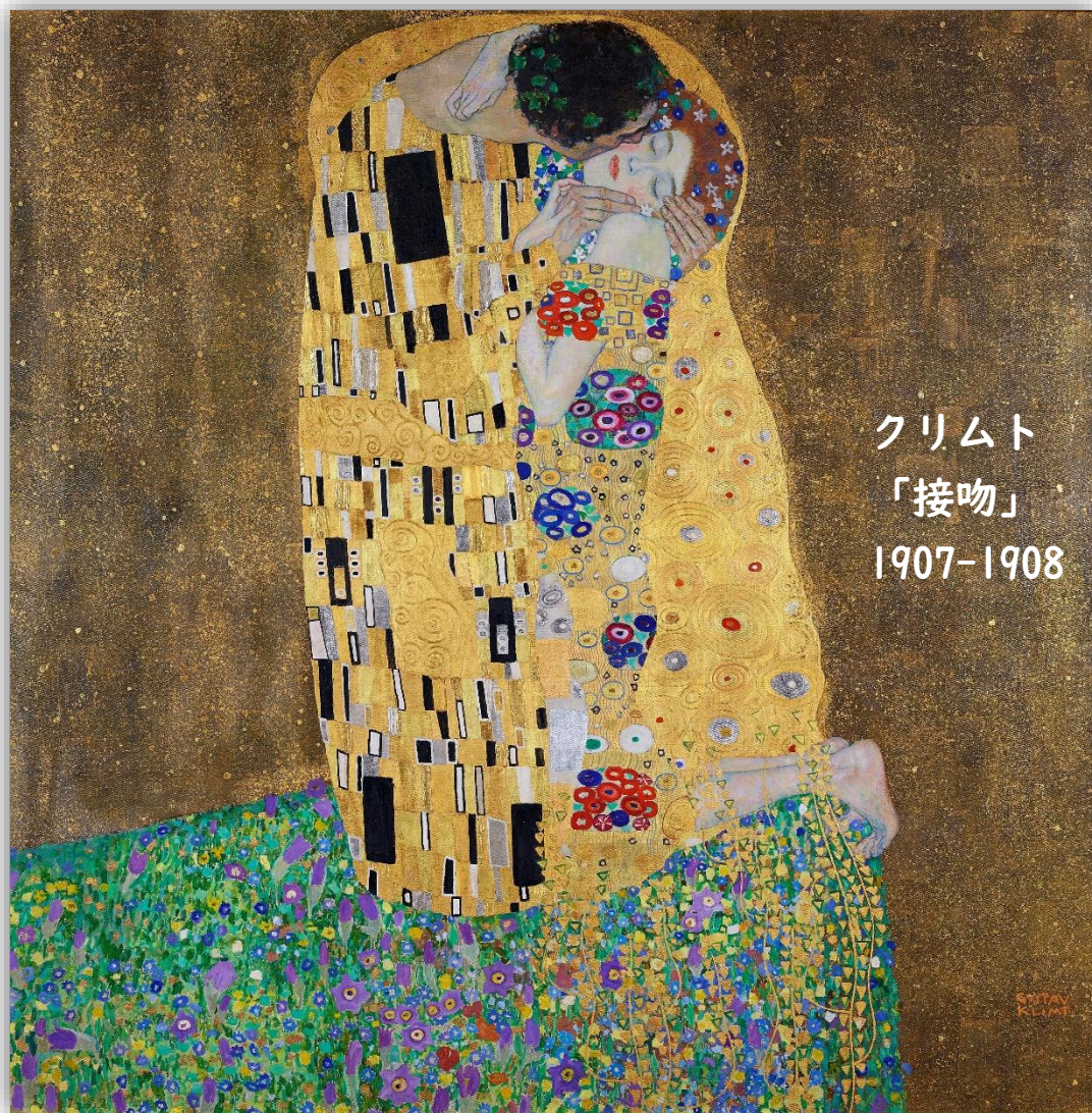
クリムト 「接吻」 1907-1908