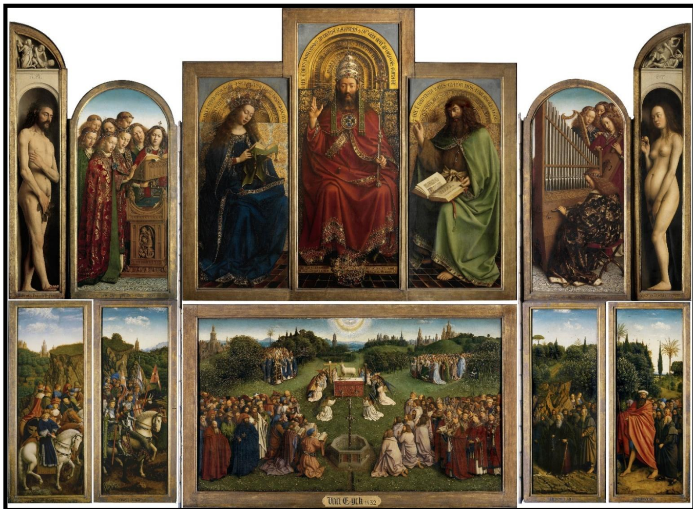
ファン・エイク「ヘントの祭壇画」(1432)