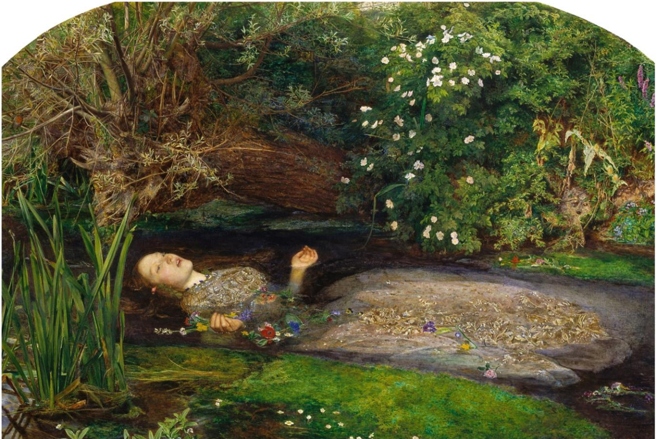
ミレイ「オフィーリア」